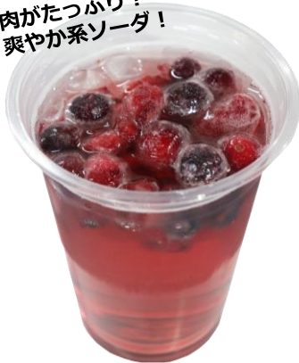
▲カシスベリーソーダ 500円 【販売店】内野3F タイガースフードコート アルプス3F 甲子園カレー 外野2F タイガースフードスタジアム