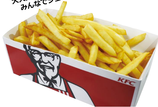
▲ウル虎BOXポテト 800円 【販売店】：KFC