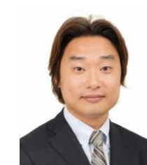
MBSアナウンサー 井上雅雄アナ