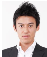
ABCアナウンサー 高野純一