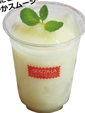
▲瀬戸内レモンはちみつスムージー 500円 【販売店】：ピザラエクスプレス