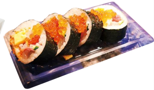
▲イクラをのせた極上海鮮巻き 750円 【販売店】：甲子園寿司※内野のみ