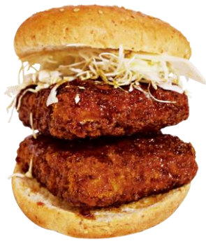
▲ウル虎勝つサンド 650円 【販売店】KFC