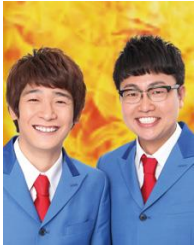
銀シャリ 鰻和弘さん 橋本直さん